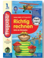
Fragenbär – Richtig Rechnen: Rette die Glückspilze

Sprachen: Deutsch Altersangabe: 1. Klasse Verlag: SL Spielend Lernen Verlag Web: www.fragenbaer.de Preis: 16,90 Euro Bezug: Über (Internet-) Buchhändler erhältlich ISBN 13: 978-3-8032-4641-7 Systemanforderungen: Mac OS 10.2 oder höher, Power Mac G3, 64 MB RAM, CD-ROM-Laufwerk